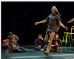
El fill que vull tindre