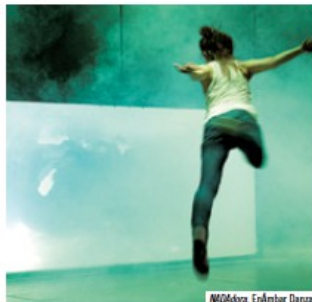
WOMORA. EnÀmbor Danza