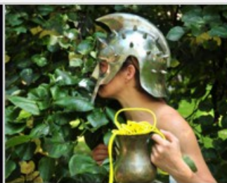
El cielo ahora