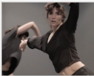
No half measures