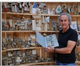
Biblioteca de cuerdas y nudos